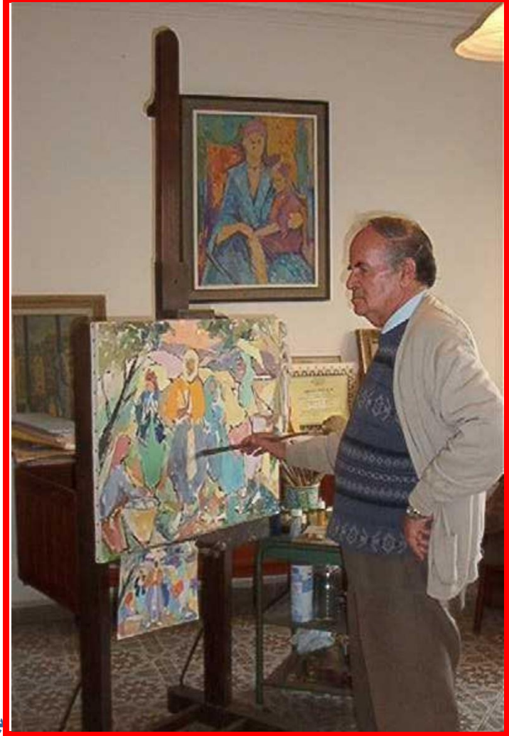
بشير يلس فنان جزائري من

تلمسان ، ولد في 12 سبتمبر 1921. هو أحد أهم الرسامين المعاصرين الجزائريين، درس بثانوية دي سلان ( بن رجب حاليا) بتلمسان من ( 1932الى1942 ) انضم الى مدرسة الفنون الجميلة بالجزائر تحت اشراف (أندرية دي باك و لويس فارنيز من ) 1943الى1947) شارك سنة 1944 في "المعرض الأول للرسم والمنمنمات الإسلامية في الجزائر بالاعمال التالية: صورة قاضي تلمسان و عرس في تلمسان (منمنمة)- مناظر من تلمسان- مسجد سيدي الحلوي 1946و في سنة قام بانجاز منمنمة بن باديس استنسخت الى أكثر من 5000 نسخة هيلوجرافية . بيعت النسخة الأصلية لجمعية العلماء المسلمين الجزائريين . تحصل سنة 1947 على جائزة الشرف للفنون الجميلة التي تمنحها الحكومة العامة في الجزائر. في معرض في تلمسان بالأعمال التالية: درب سيدي بلحسن،صومعة المنصورة، الأندلسي، الشحاذ .